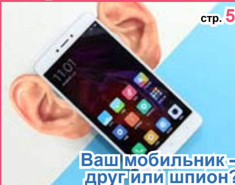
Ваш мобильник = друг или шпион?