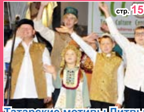
Татарские мотивы Литвы