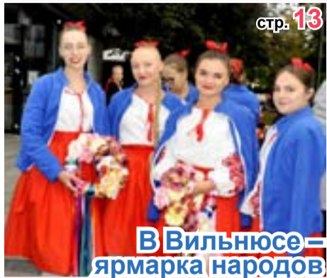
В Вильнюсе – ярмарка народов